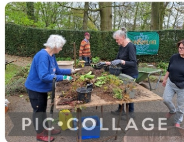
Fotocollage: Hilda van Vliet