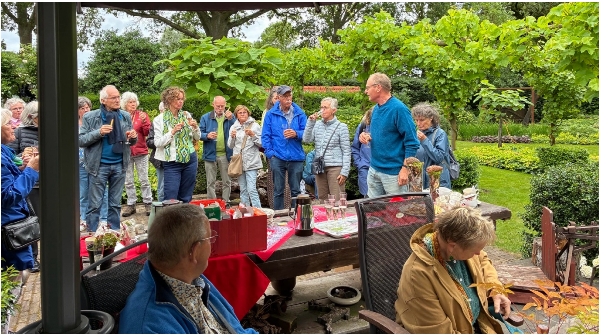
Proosten op de jarige afdeling!